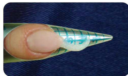
3. Za pomocą transparentnego pudru z drobkami brokatu modelujemy falowany zawijas