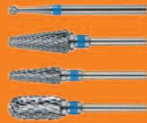
WIERTŁA ZE STOPU TWARDEGO