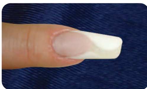
5. Budujemy warstwę za pomocą pudru clear i ściskamy końcówkę specjalnym zaciskiem