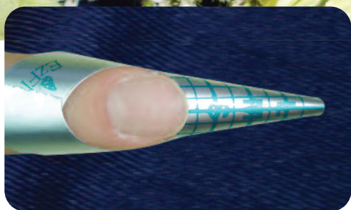
1. Przygotowujemy płytkę i mocujemy formy