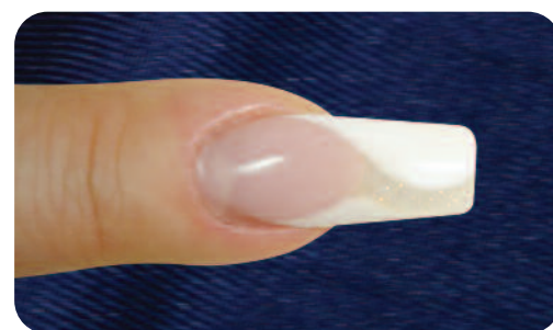
6. Opracowujemy paznokieć, nadajemy mu odpowiedni kształt, polerujemy i nabłyszczamy lakierem ultrafioletowym, aby uwydatnić biały kolor